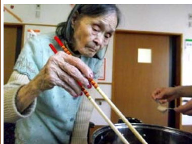
真剣に揚げ具合を見極めて!!