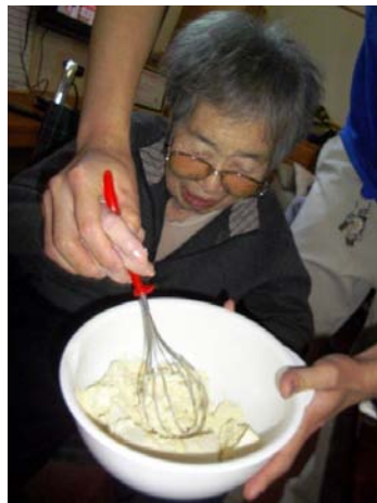
粉にもヒ・ミ・ツがあります