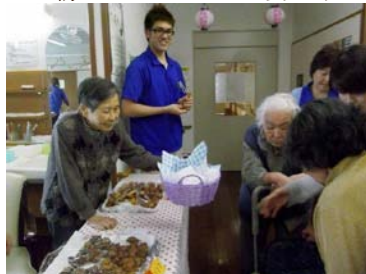
ドーナツ屋さんの開店です!