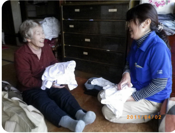
最優秀賞：「笑顔がステキね」訪問介護ばから