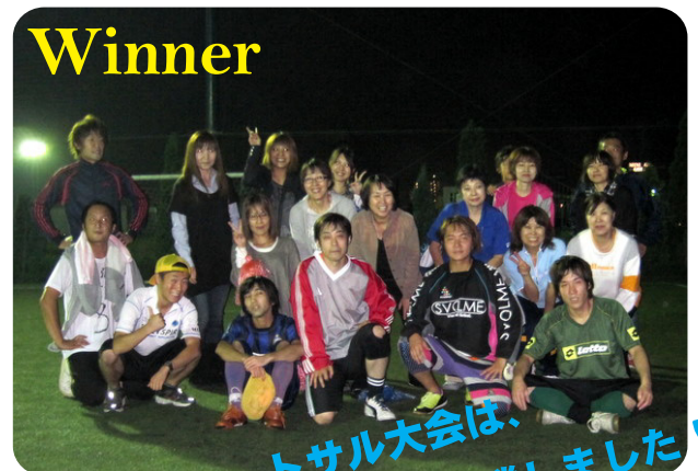
第2回ようざんフットサル大会は、 ようざん栗崎&総務チームが優勝しました！！