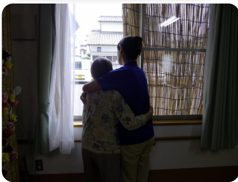
奨励賞：「信頼」 スーパーデイようざん双葉