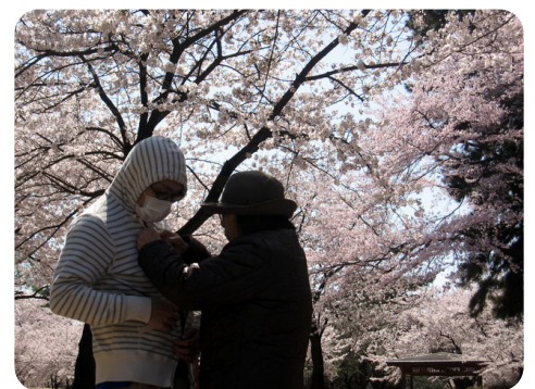
専務賞：「かあさんありがとう」 スーパーデイようざん飯塚