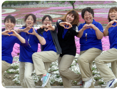
社長賞：「ラブ注入」 スーパーデイようざん員沢