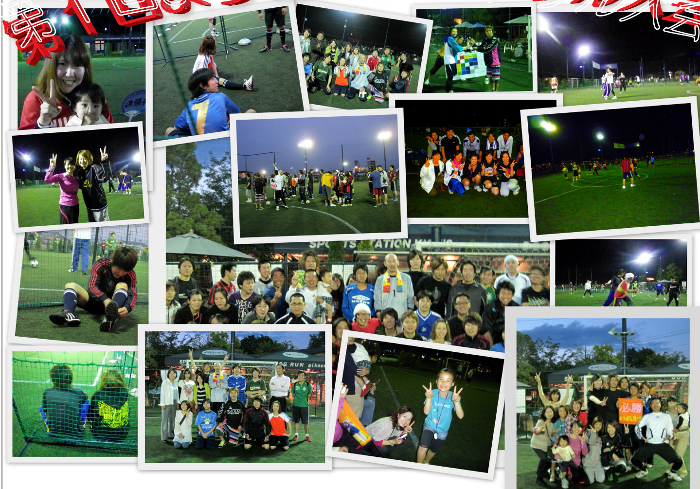
優勝チーム ようざん貝沢

平成23年5月25日フットサル会場にて『第1回ようざんフットサル大会』を開催しました。当日は怪我もなく、スタッフ一同大盛況で終了することができ、多くのスタッフの笑顔が見られて心から嬉しくなりました。ようざんスタッフ全体が盛り上がった大変有意義な時間でした。