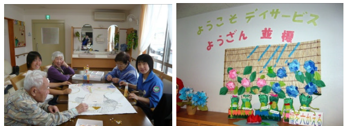
並榎中の生徒さんとレクリエーション

に作り上げています。今、デイサービスようざん並榎の入り口には手作りの紫陽花が咲いています。(蛙やカタツムリもいますよ！)散歩やドライブ以外でも四季折々、色々なところで季節を感じる事が出来喜んでいただけたら嬉しく思います。是非、紫陽花をみに気軽に立ち寄りください。(猪俣)