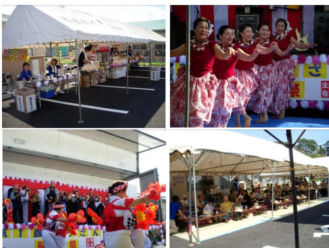
昨年の敬老祭の様子