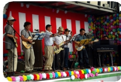
迫力あるライブを披露して頂いた“おやじバンド”いつもありがとうございます。