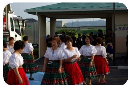
中川レクフォークダンスの皆さんです。楽しいダンスでした。