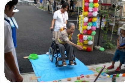
輪投げやヨーヨー釣りは、みんな童心にもどって大喜び！！