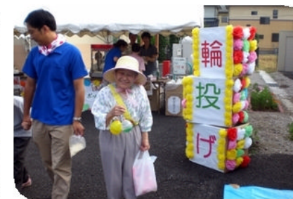
お祭り気分を盛り上げるための飾り付けも利用者様と創意工夫しました。