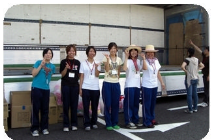
沢山のボランティアスタッフが力仕事や地味な仕事も率先して朝から晩まで手伝っていただき大変助かりました。ありがとうございました。