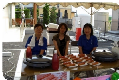
屋台を職員の娘さんもつだって頂きました。ありがとうございました