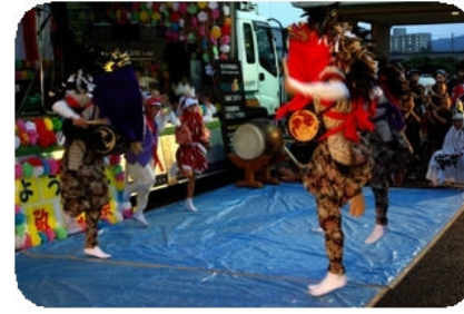
日が暮れてきて獅子舞は非常に幻想的でもありました。