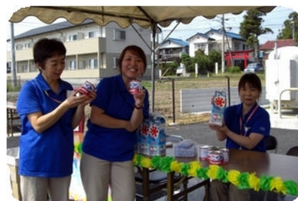
当日は、天気が良かき氷は、大盛況でした。