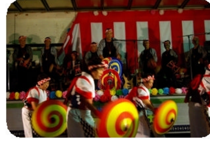
地元上並榎の八木節保存会の皆さん、幼稚園のお子さんも踊ってくれて可愛らしかったです。