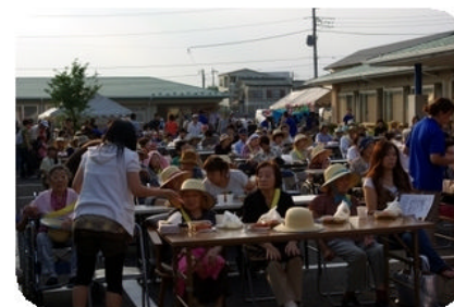
ご家族と一緒にイベントでご利用者様も普段とは違う笑顔を見させて頂きました。