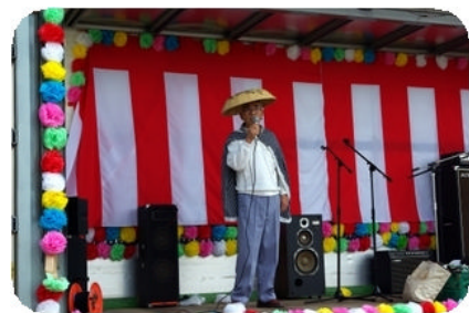
利用者様も飛び入り参加してくれました。来年はのど自慢大会も検討します。