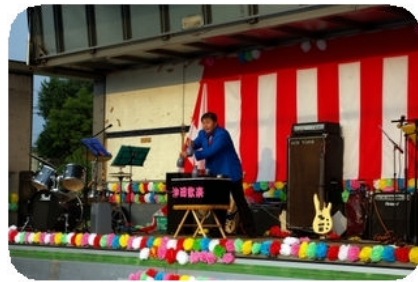
楽々マジックの皆さん。プロ級の鮮やかな腕前を披露して頂きました。