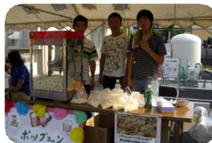
しのめ信金並榎支店のみなさんがポップコーン屋台を出してくれました。