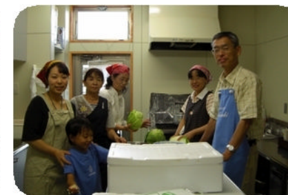
家族会の皆さんが焼きそば屋台を出してくれました。