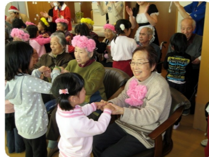
“やまだのかかし”の歌に合わせてみんなで手遊び