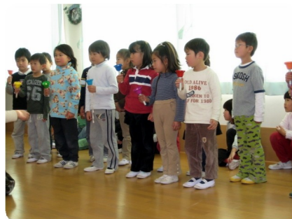
ハンドベルでクリスマスソング の演奏をしてくれました。