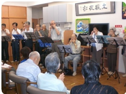
西ハーモニカクラブ