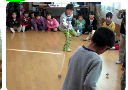
“あんたがたどこさ” 名人・“びゅんびゅん” 名人・“コマ回し” 名人、どの名人も真剣に技を披露 してくれました。しかもその技は本当に名人級でした。