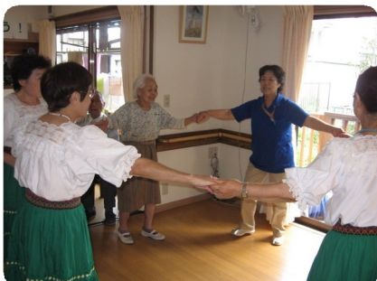
レクフォークダンス