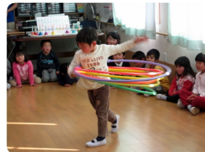
フラフープ名人、6本同時の荒 技にみんなびっくり