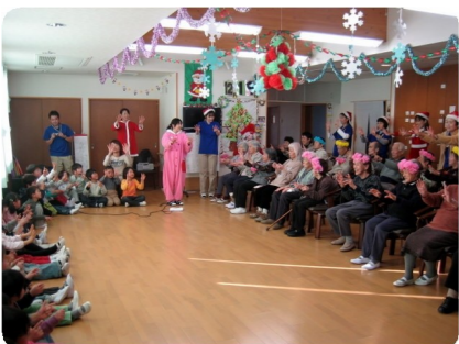
わらべ唄にあわせて指の体操