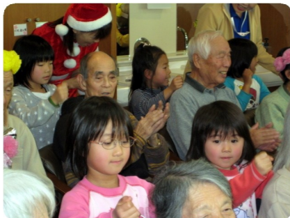
唄に合わせて、肩を叩いてくれ ました。