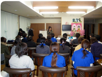
排泄ケアの講習会の様子