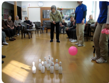
競技のレクは白熱します