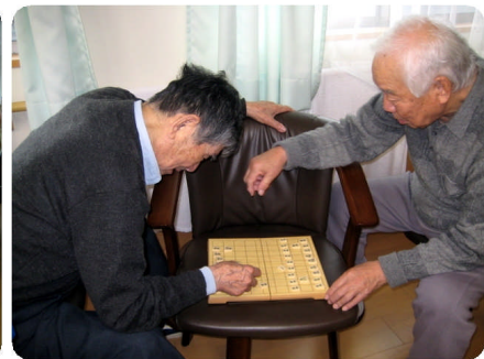
男同士で将棋の対戦