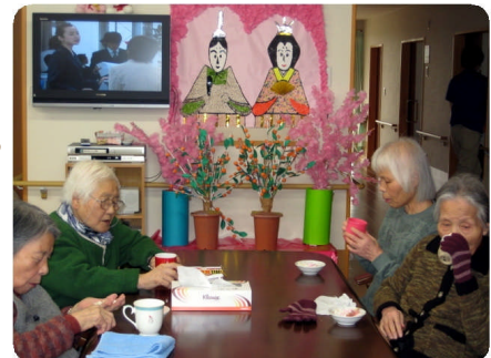
みんなでお雛様の壁画を製作しました。

での相談や悩みを気軽に伝えて頂きたいと思っております。そして御家族様・利用者様の気持ちに寄り添いながら、一緒により良いケアを考えて認知症の真のプロとして日々精進していく所存です。「主権在客」である、ようざんの理念を基に、利用者様・ご家族様の笑顔を守るためにスタッフ一同で頑張っていけます。(渡丸)