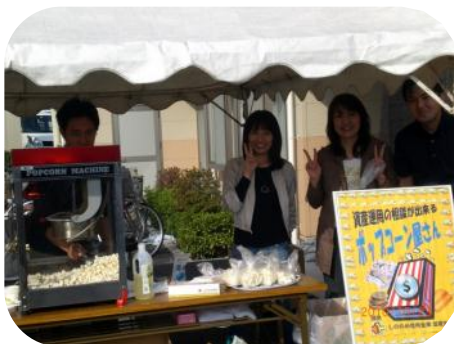
しののめ信金並榎支店のみなさん