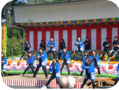
高崎経済大学の学生のみなさん