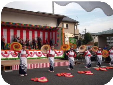
上並榎町八木節保存会のみなさん