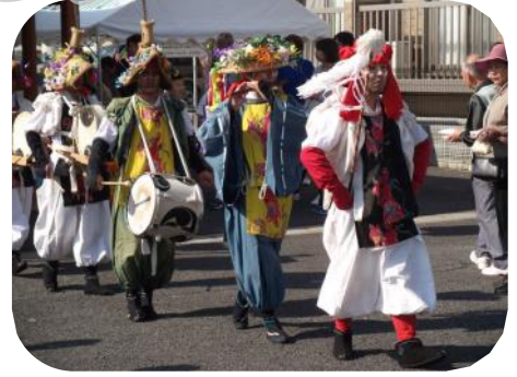
大田楽のみなさん