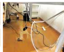
絡みついたコード類

みなさんには事務所だけでなくご自宅も含めてコンセント回りや配線状況の安全確認をお勧めします。