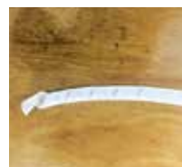
コードを束ねる 部材の1例