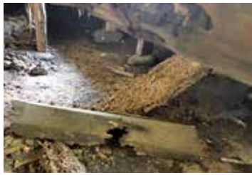
① 蟻害で朽ち落ちた状況