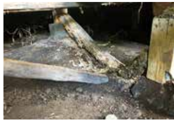
② 蟻害にあった土台