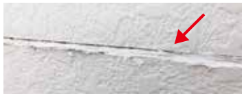
①補修前の状況写真