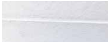
②補修後の状況写真その1