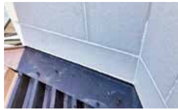
③補修後の状況写真その2