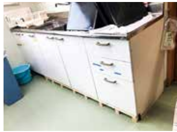
②キッチン収納改修後