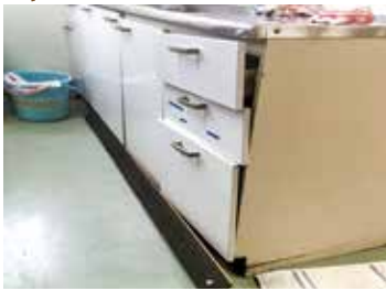
①キッチン収納改修前