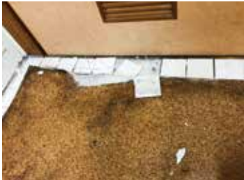
③脱衣室床・改修前