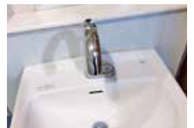
③人感センサー型水栓

また写真③は人感センサー付きの混合水栓です。手をかざすと吐水し、かつ吐水量の設定もできるものですが、現場ではセンサーの異常で誤作動がおきています。これもシンプルなシングルレバー合栓に変更する予定です。これからも水栓に限らず各種設備機器で機種変更があると思いますがご理解ご協力をお願い申し上げます。