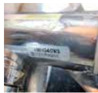
①デジタル表示型混合水栓

慣れないうちは戸惑いもあるかと思いますが、不特定多数の人が使い、使用頻度の高い場所では多機能な水栓よりもシンプルなものが故障もなく長く使えるのが特徴です。