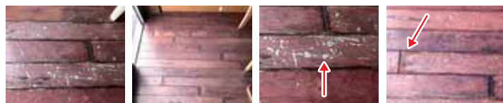
①木質系フローリング(局部) ②木質系フローリング(広範) ③フィルムの剥れた部分 ④合板まで疲弊した部分

今回ご依頼頂いたフローリング補修はその複合フローリングです。 現場の状況は③の写真で見えるようにフィルムが剥がれたり、④下地の合板が露出したりとかなり疲弊が進んでおります。部分的な補修ですと簡易補修キットで対応できますが今回の場合広範囲にわたる