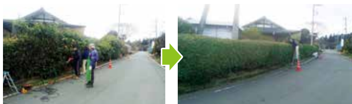
作業前(どこかに私が、、、)

便利屋ファミリーようざん高崎中央店では、テレビアンテナ取り付け、エアコン取り付け取り外し、エアコンクリーニング、洗濯機クリーニング、換気扇取り付け、レンジフード取り付け、ハウスクリーニング、浴室掃除、キッチン清掃、ベランダの清掃、お庭の草刈り、剪定、鳩ネットの取り付